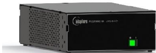
图 1 LFPA-8 机械外观图

蓝菲光学高精度皮安表 LFPA-8 是一款高精度的电流表，其能够实现及其微弱电流信号的测量。该产品具有噪声低，误差小，可编程，分辨率高等诸多特点。此外，通过内部自动切换量程范围，可以实现从 fA 级到 mA 级的大动态范围电流测试。