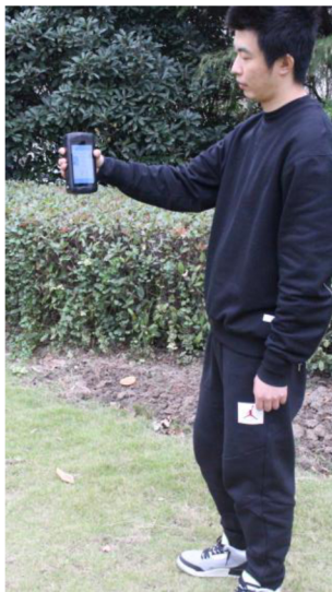
图 1. 产品使用示意

蓝菲光学 LFRT-H100 手持光谱反射率测试仪基于安卓平台集成了可见到近红外 CCD 光谱仪，获取反射光谱并计算反射率。便携式的设计便于应用于多种场景，特别是户外使用。测试数据可以保存或上传，便于离线分析。